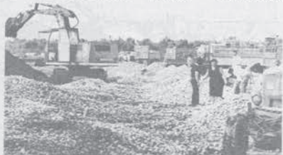
Teano (NA) luglio '75 - La distruzione della frutta

Il PCI, in tutto questo, mentre insieme alla DC prepara il piano agro-alimentare, si limita a chiedere una generica « svolta » e a parlare di politica delle strutture senza chiarire quanto questa politica si differenzi da quella sempre richiesta dalla CEE. Sono lontani, come si vede, i tempi in cui chiedeva la uscita dell'Italia dal Mercato Comune Agricolo. Eppure, era soltanto il 1968.