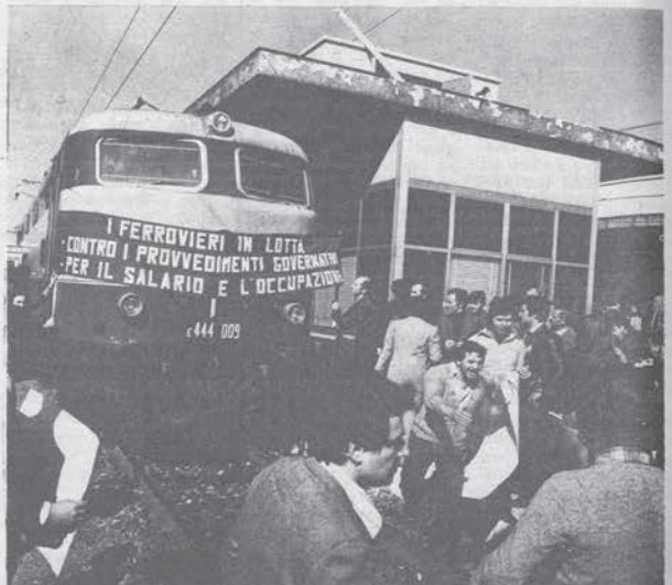
« Questo è innanzitutto il senso dell'assemblea nazionale proposta dalle avanguardie dei consigli di Bologna, Firenze, Roma per il 10-11 settembre, dopo che le risoluzioni dell'assemblea precedente di fine luglio sono state viste e discusse da centinaia di compagni »

Domani pubblicheremo un intervento di due compagni delegati di S. Maria La Bruna.