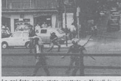
Le sei foto sono state scattate a Napoli in occasione della manifestazione per Petra Krause