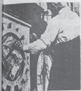
145: una svastica viene scalpellata via da un edificio pubblico di mburgo