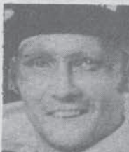
N. Lauda: al Kg. costa 24.000 dollari