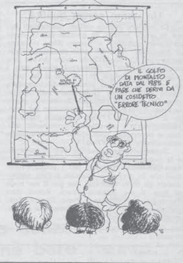
Montalto di Castro: a pagina 10 un intervento sulla manifestazione di domenica scorsa.