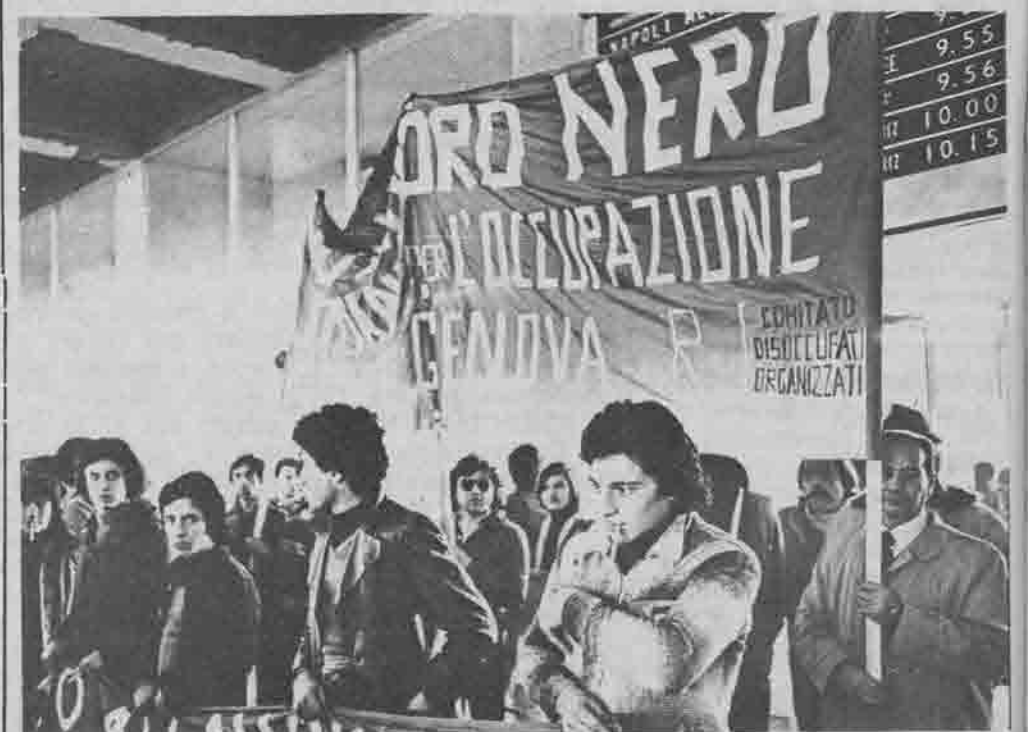
I disoccupati del porto di Genova alla manifestazione di Roma

Venerdì 2 aprile alle ore 16 assemblea dei disoccupati organizzati presso il comitato di quartiere del centro storico.