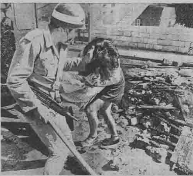
David e Golia. Le prodezze degli occupanti israeliani a Gerusalemme

compromesso basato sulla «equivalenza delle forze in campo». Tanto più che l'altro polo di questa grandiosa ondata di lotte autonome, nazionali, la Palestina occupata, non fa prevedere per niente una stabilizzazione nell'area. In Galilea, sotto la minaccia di ulteriori massacri e atrocità israeliane rappresentate da un virtuale stato d'assedio, si sono svolti i funerali di 4 dei 7 arabi uccisi durante lo sciopero generale. Hanno partecipato tutti gli abitanti dei villaggi interessati. E mentre al parlamento del Knesset si svolgeva un violento dibattito sull'opportunità di rinviare con la repressione omicida anni di manipolazione di un presunto consenso, imperniato sulla mozione di sfiducia a Rabin presentata dal Rakah (il PC filo-sionista), i giovani che in Galilea avevano per la prima volta risposto con la forza all'oppressione israeliana, dicevano: «Il nostro canuto è con il fuoco e con il sangue ci riprenderemo la Galilea».