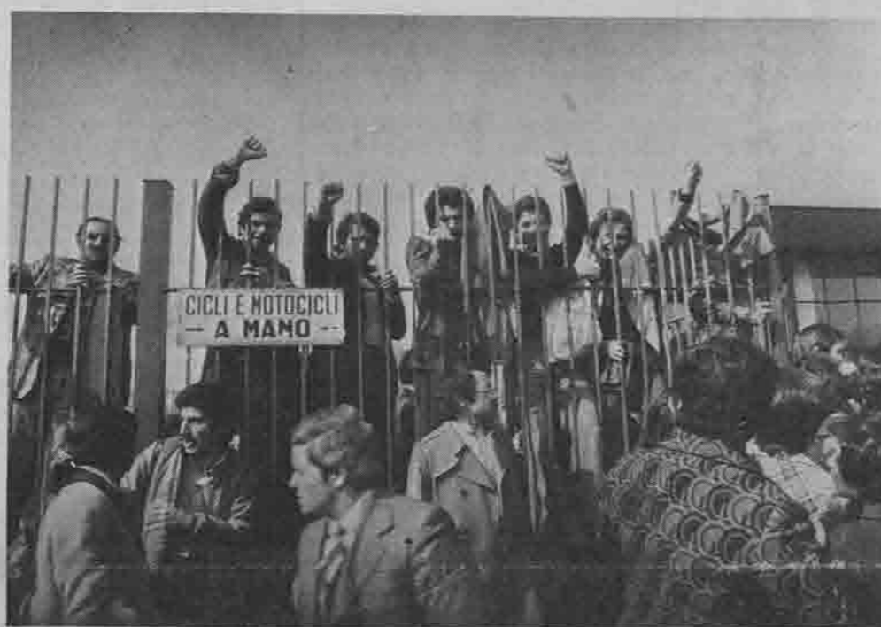
Gli operai di Rivalta di nuovo ai cancelli, come i loro compagni della FIAT di Volvera e dell'OM di Milano, mentre, sempre a Torino si ritrovano in strada gli operai della Fiat di Lingotto e della Avio. Domani sarà il turno degli operai dell'Alfa Romeo di Arese. A Rivalta la decisione è stata totalmente autonoma in risposta alla sventata sindacale, di un'importante lotta per il salario e alla rappresaglia di Agnelli. (Nella foto: i cancelli di Rivalta la settimana scorsa).

I conti sono già cominciati, il treno non era ancora arrivato alla Stazione di Palermo che già lo sciopero generale autonomo bloccava tutta la valle.