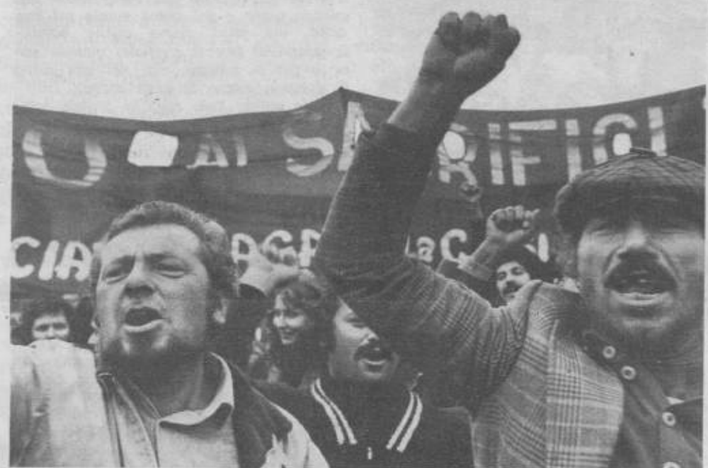
La manifestazione del 10 novembre '76 a Roma per lo sciopero generale del Lazio

Vogliamo discutere di alcuni problemi specifici della nostra situazione che solamente accenniamo: si può definire Roma una città industriale? Siamo abituati a dire di no, ma sappiamo che ci sono 20 mila addetti alla pellicceria — e sono operai — o sappiamo quanti sono i poligrafici e cartai effettivamente, per non parlare del commercio che non riesce a controllare, per sua stessa ammissione, nemmeno il sindacato. Roma ha un'immigrazione divisa dalle città del nord, ma che