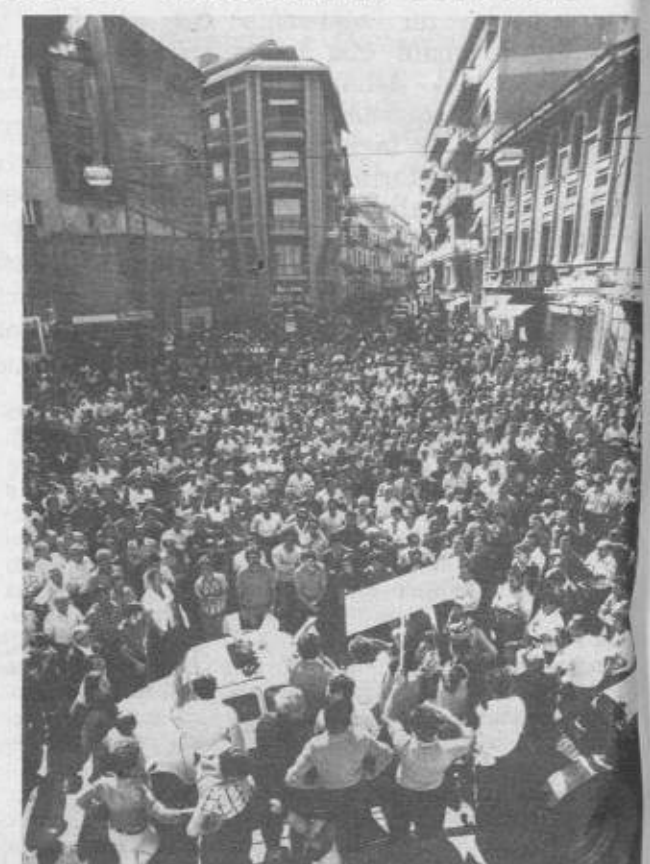
Le foto di questo servizio sono state scattate il 1° ottobre ad Ortona, durante la prima manifestazione autonoma indetta dal Comitato di lotta

La discussione tesa, veloce e decisa sulle decisioni concrete, ma anche appassionata a lunga su come andare avanti, con la presentazione davanti agli occhi dei presenti, di quanto si possono fare, quando si agisce in un'organizzazione dove sono tutti legati ad un'unica volontà di lotta. Si è parlato così di andare dai consigli di fabbrica, di formare una cooperativa, di intervenire come comitato di lotta anche su tutti gli altri problemi dei paesi di allargare la propria esperienza in altri paesi, da quelli dove si coltivano le patate a quelli delle ciliege. La riunione si teneva in un'osteria, il sindaco democristiano di Lanciano aveva vietato il cinema, perché ci doveva essere una riunione del suo partito. Di cosa discutevano nel cinema Mazzini? Delle ragioni del crollo del tesseramento alla DC e alla Coldiretti; in un'altra sala della città c'era anche il PCI: discutevano di come fare davanti ad un calo clamoroso del loro tesseramento, — la provincia di Chieti è ul-