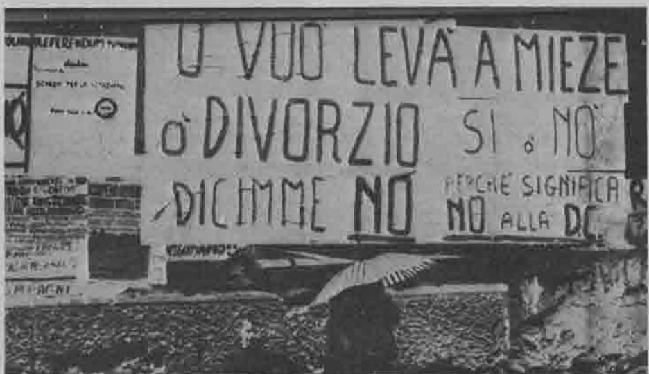
Napoli, maggio 1974

Il PCI ha raccolto ampi travasi di voti, non solo dalla DC che ha visto pesanti emorragie dopertutto, salvo che in Sicilia e più moderatamente in Puglia oltre che a Sassari, dove l'intero serbatoio di voti al MSI si è però seccato, ma anche con travasi diretti dalla destra, come dimostrano esemplarmente Napoli e Catania, e in misura minore anche la Calabria. Dietro l'onda operaia, che già si era fatta sentire il 15 giugno, viene il mare del proletariato senza lavoro, dei giovani, delle donne (il PCI ha eletto 6 donne al sud e anche il loro successo è una spia, in piccolo, del comportamento elettorale delle donne che, specie nei paesi, hanno contribuito massicciamente a questi risultati). E dietro a tutto questo tornano con forza, recuperando guasti, le campagne, i comuni che in molti casi avevano visto il 15 giugno voti di protesta contro il PCI. Lentini: in un anno si passa dal 32 al 53 per cento; Marsala, recupero completo; Mazara del Vallo, eccetera, ne sono alcuni esempi, oltre a quelli già citati. Ancora sulle campagne. Se è soprattutto al nord, nelle zone bianche del nord, che la Coldiretti ha ritrovato smalto affidandosi ad ignoti allevatori che hanno fatto la loro figura in contrapposizione ai ladroni della Lockheed, al sud questi successi sono validamente contrastati da una forte ripresa del PCI nelle campagne.