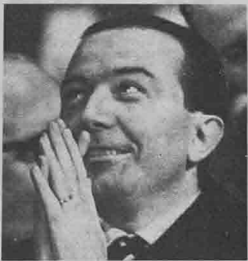
Superburocrati, prendete a piene mani il bottino delle vostre liquidazioni d'oro che vi ho assicurato. Ma fate in fretta! Il vostro Giulio Andreotti

Una fuga di dirigenti di grossi enti pubblici e privati si sta verificando in questi giorni in Italia. Ma, al contrario dei capitali, questi signori — più conosciuti col nome di «super burocrati dagli stipendi d'oro» — non vanno in Svizzera, vanno solo in pensione anticipata, con una «indennità di liquidazione» di una entità direi cospicua: somme che oscillano intorno ai cento milioni e che prenderanno, queste sì, la vecchia e sicura strada d'oltralpe.