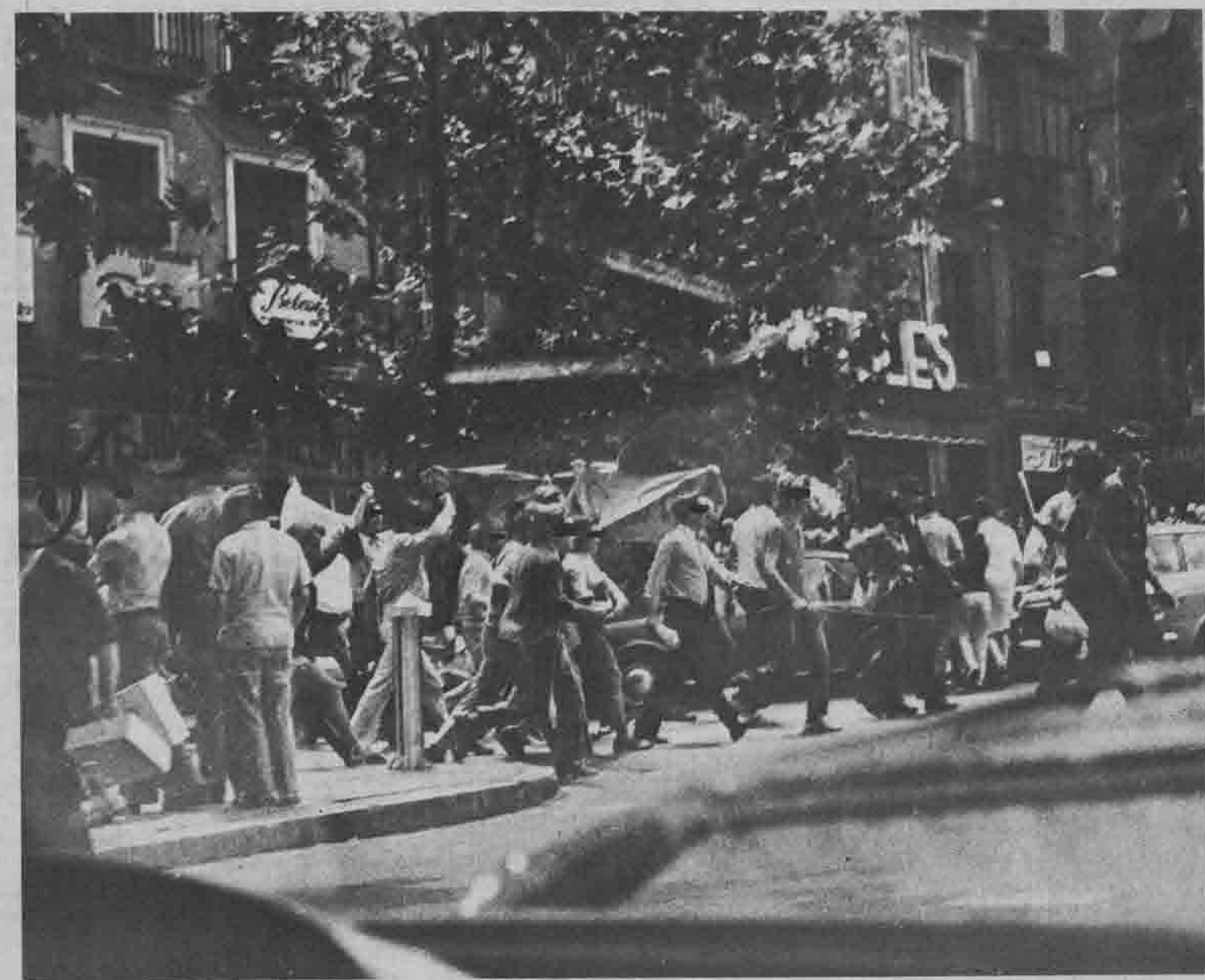
Spagna: Una combattiva manifestazione del periodo franchista

Il « bunker » spagnolo, la destra oltranzista, ha già aperto il fuoco con un discorso del ministro delle forze armate, generale, Alvarez-Arenas che ha lanciato una sorta di crociata contro la propaganda sotterranea dell'opposizione e la decadenza dei costumi e della morale. Era una reazione scontata della destra alla politica di liberalizzazione controllata e limitata del re, ma il fatto che sia partita dagli alti quadri militari suona come un monito particolarmente minaccioso e dimostra quale sia la distanza che separa ancora l'aperturismo del potere dal suo pur programma minimo del PCE. Nonostante tutto il gradualismo perseguito da ambedue le parti, questa politica dei « piccoli passi » non sembra portare molto lontano. Saranno comunque le masse alla ripresa autonoma a dire in che misura intendono accelerare questo processo « a passo di lumaca » di transizione dal franchismo alla democrazia pluralistica.