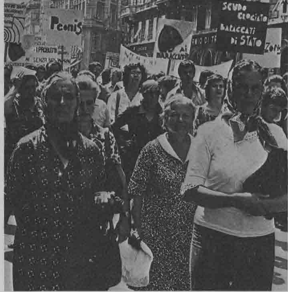
Trieste, 16 luglio 1976