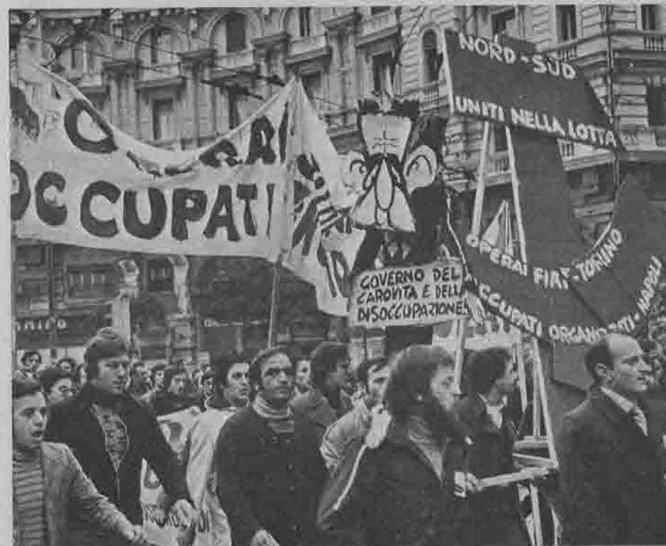
Napoli, 12 dicembre 1975

Dei due milioni e mezzo che perdono, un milione è perso in un anno soltanto. Da questi dati relativi al crollo dell'area di centro-destra viene confermato che l'emorragia di voti dalla DC a sinistra è proseguita dappertutto, con l'eccezione di alcune zone in prevalenza «rosse», e che questa emorragia è stata compensata dal vorticoso tracollo dell'area di centro-destra che nasconde, co-