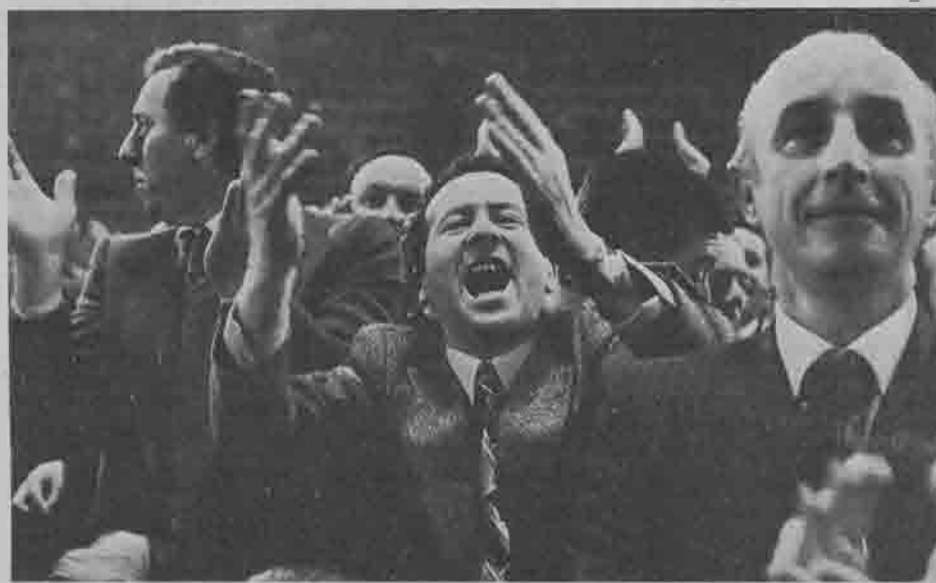
Roma, 13° congresso della Democrazia Cristiana

mentre gli aumenti più ridotti riguardano le province meridionali dove più consistente è il peso della classe operaia (Napoli, Taranto, ecc.) e i cali ulteriori interessano le province Trentino-Sudtirolo, della Calabria, e di altre regioni bianche del sud.