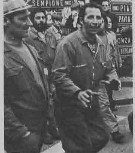
Milano, marzo 1976

Una interpretazione delle punte di flessione molto alte collezionate dal PSI, e in particolare al sud, sta certamente nel venir meno di una pratica di sottogoverno e di clientela con cui il PSI aveva sperato di fare concorrenza alla