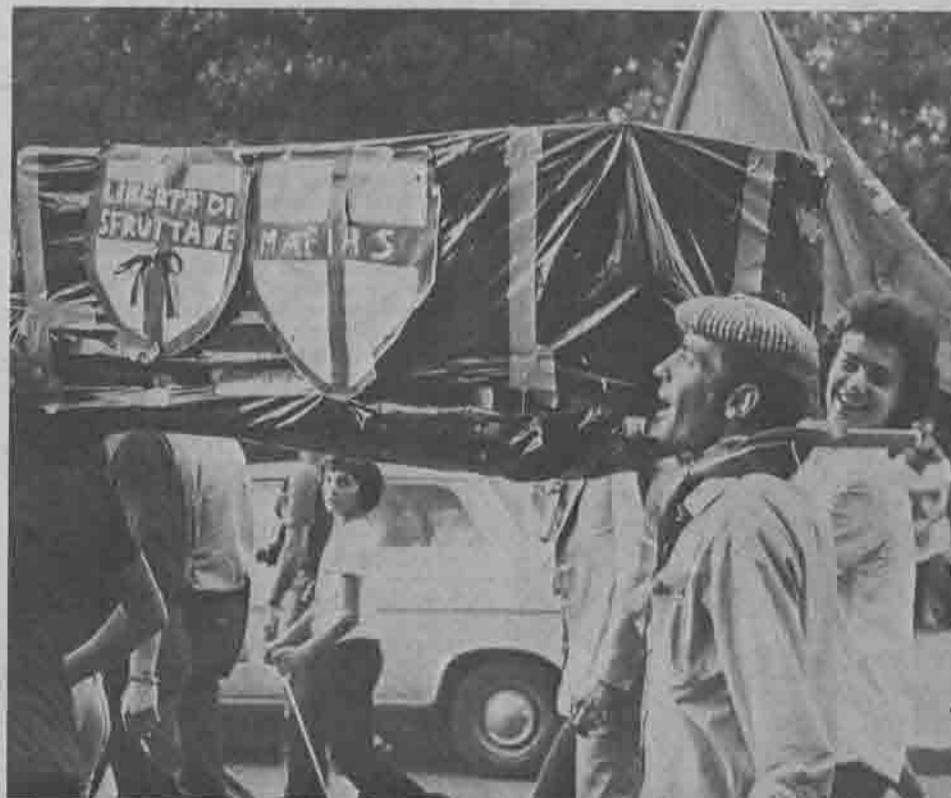
Roma, 17 giugno 1975

Su quei risultati non c'è arretramento, ma al contrario c'è un rafforzamento dello spostamento a sinistra che assume i caratteri della radicalizzazione, toglie spazio alle posizioni centriste, libera nuove forze dal controllo democristiano, determina una modificazione profonda nel partito di regime, cambiano i connotati e isolando all'interno di un'area che non esiste più.